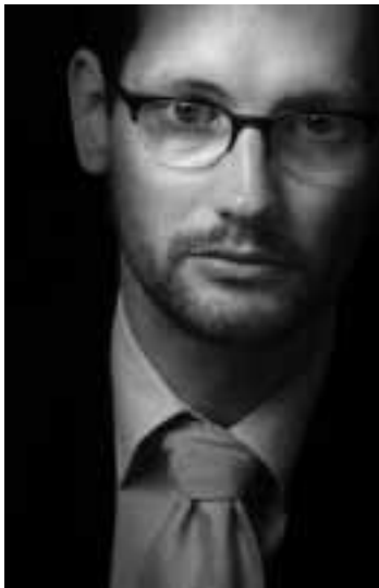
ELMAR KUIPER