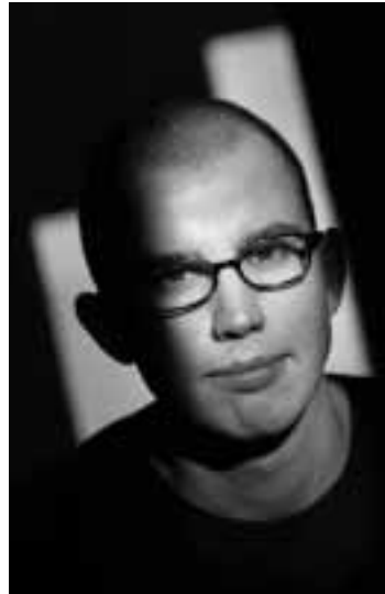
TSEAD BRUINJA

steat is om agressive ympulsen ûnder kontrôle te hâlden. Biolooch K. Lorenz skriuwt dêroer yn 'Agressie bij dier en mens'. Neffens him binne by de mins it ferstân en ynstinkt útelkoar groeiid. De bile en it fjoer wiene noch mar krekt útfûn of de mins huft syn meiminske dermei dea en friet se op. Tinken en taal ha enoarme en hurde feroarings teweechbrocht (eksplosive groei fan de neocortex*), dy't de ynstinktwrâld net byfytse kin. Wy libje mei in âld brein yn in nije wrâld.